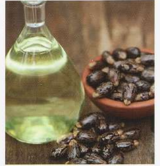
* ヒマシ油：非可食の植物トウゴマ(ヒマ)の種子から採取する植物油の一種